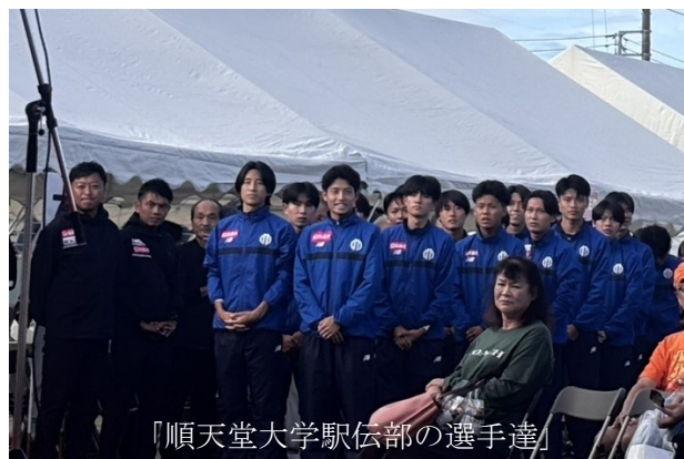
『順天堂大学駅伝部の選手達』 華賞品の数々そして順天堂大学駅伝部の選手たち