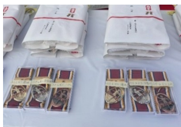
「豪華賞品(年代別優勝者メダル等)」