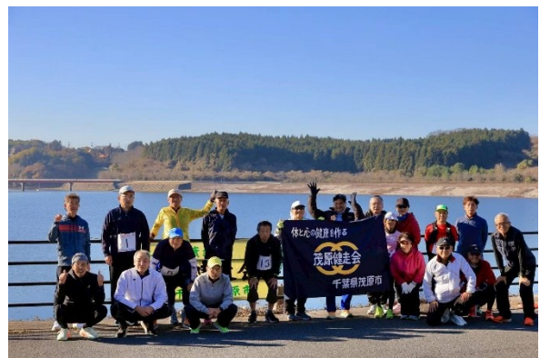
「2025.12.7 第47回 3時間走集合(長柄ダム)」